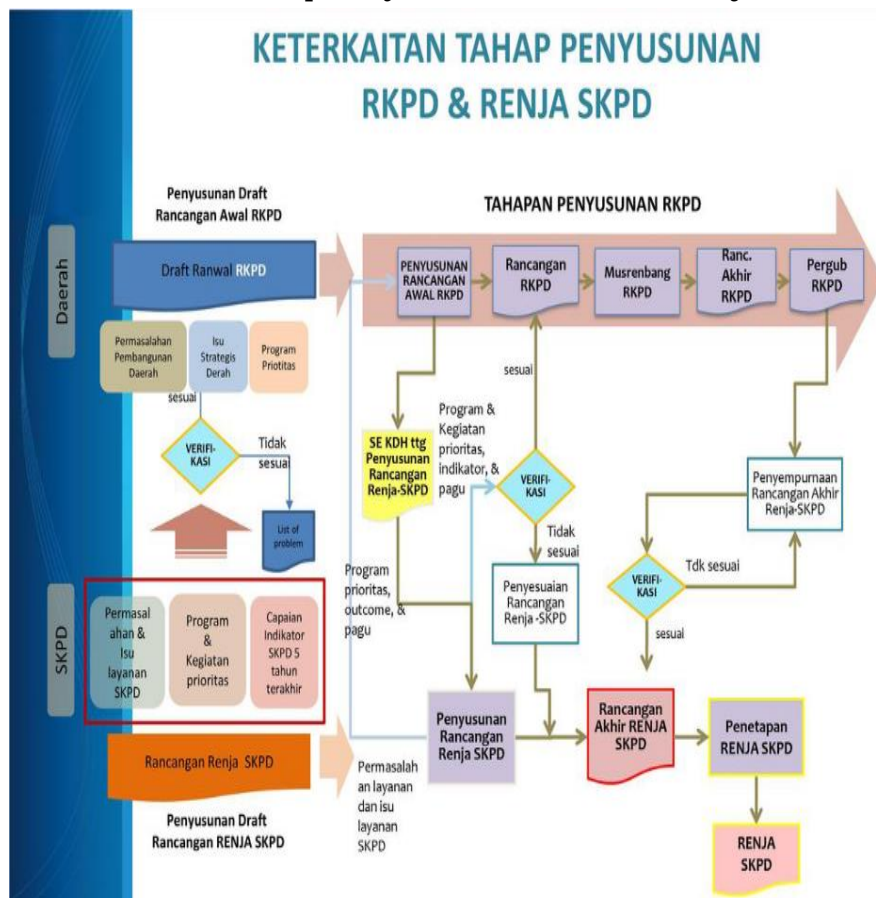
Keterkaitan Tahap Penyusunan RKPD dan Renja SKPD